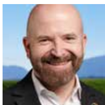
Nicolas Walder Conseiller national

La politique d'asile s'est durcie, notamment avec le pacte européen. Les attaques contre le permis S et l'accès aux soins ou aux aides sociales fragilisent les plus vulnérables, en particulier les personnes vivant sous un statut provisoire.